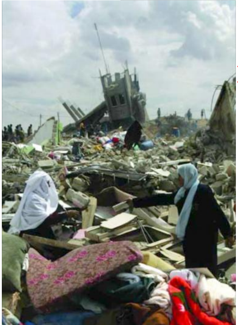
Palästinenser durchsuchen die Trümmer eines Hauses, das bei einem israelischen Bombenangriff auf die Grenzstadt Rafah im Gazastreifen zerstört wurde, 21. September 2006

Offizielle Vertreter der israelischen Armee bezeichnen die zerstörten Häuser routinemäßig als "verlassene Strukturen" und versuchen so, das Ausmaß der Zerstörung und deren Folgen für die dadurch obdachlos gewordenen Menschen herunterzuspielen.